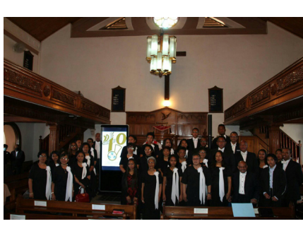
Fanokafana faha 40 taona CMA