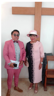
Jobily Fisotron-dronono Mme Lalah