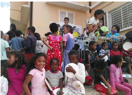
Asa sosialy ZP Bethlehema