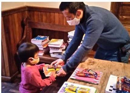
Asa sosialy FAS