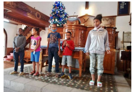
Krismasin'ireo lolohan'ny Fiangonana