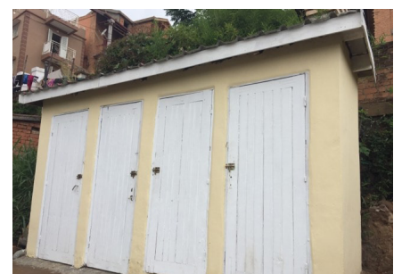
Toeram-pidiovana navaozina tao Ambatobevanja