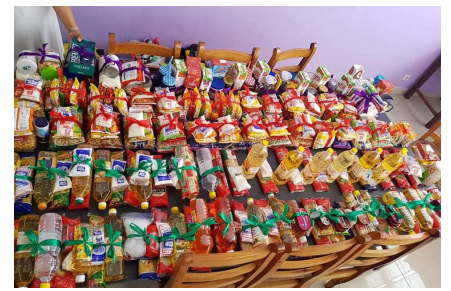
Vokatry ny Fiangonana