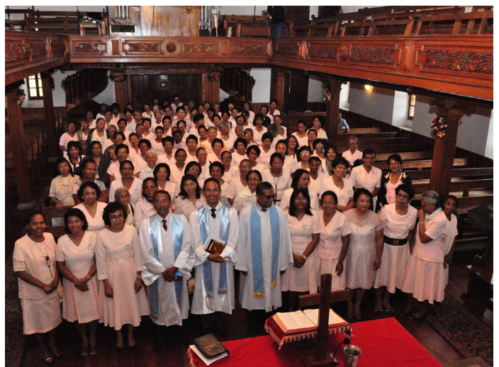
Dorkasy 4 TRANO