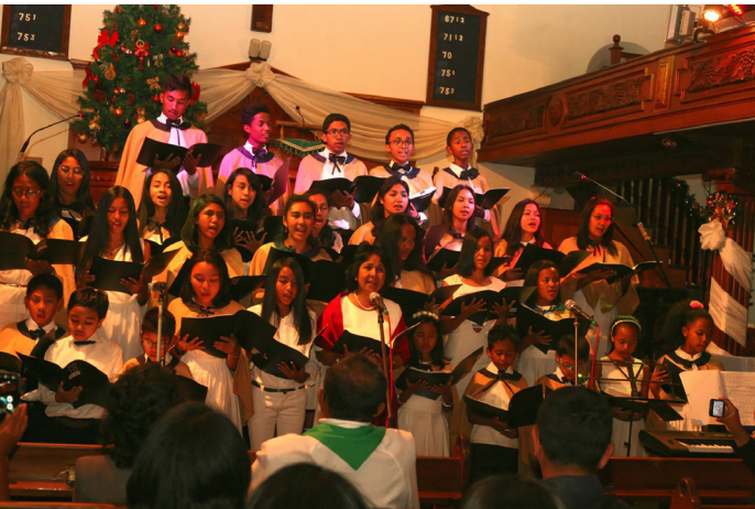
Sasa-kalina niarahana tamin'ny Feo Tantely