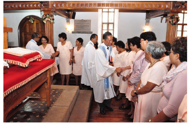
Fandraisan-tanana ireo Birao taloha sy vaovao