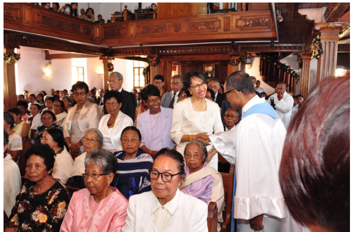
Fandraisan-tànana ireo Zokiolona 70-80 taona