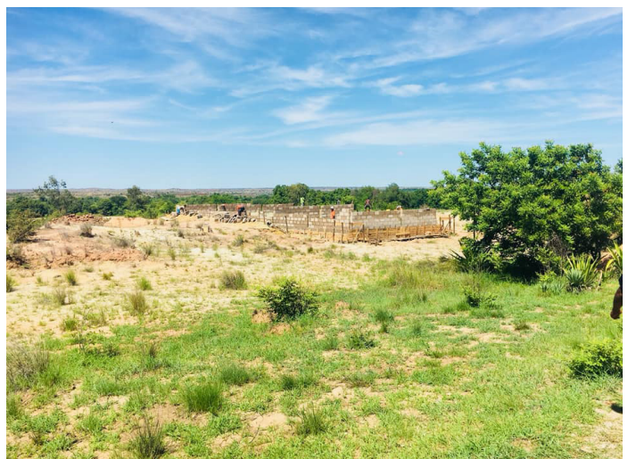
Fandroson'ny asa any Malaimbandy