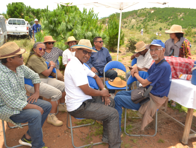
Santonan'ireo mpamboly hazo mahafinaritra