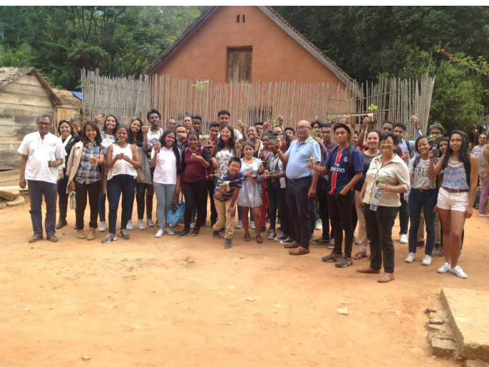
Fisindan'ny Katekomena Andia Mahery