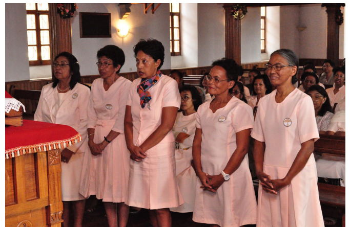
Ireo Birao vaovao