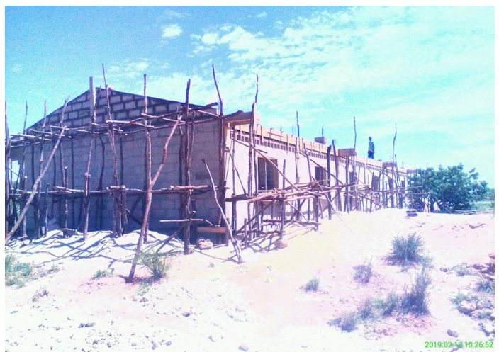
Fandroson'ny asa any Malaimbandy indray