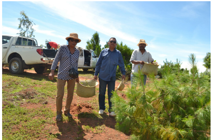
Mpamboly hazo ihany koa