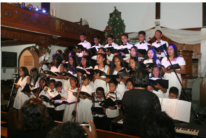
Feo Tantely IO taona